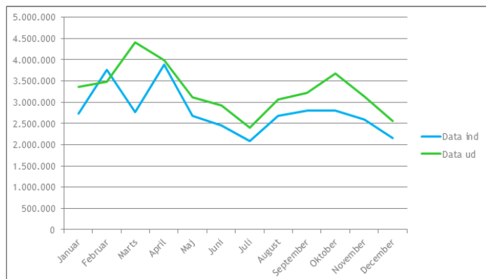
Figur 1: Data der er indberettet (ind) og hentet (ud) i DMPs systemer