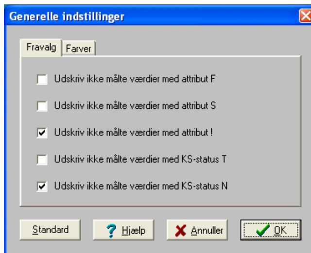
Fig. 5-1. Indstillinger af indberetningsmodulet.

I denne fane kan målinger med bestemte attributværdier fravælges i udskriften. Attributterne "F" og "S" angiver normalt frasorterede henhv. skønnede værdier, attributten "!" og KS-status "N" angiver fejlbehæftede værdier, og KS-status "T" betyder, at værdien ikke er valideret.